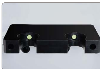
自动通/断气装置(标配)